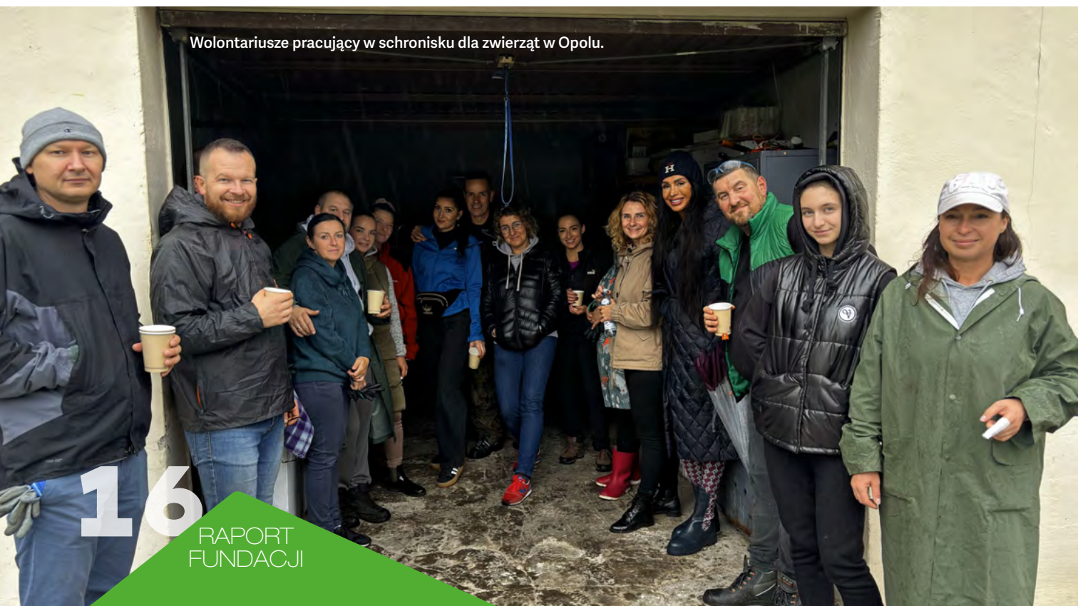
Wolontariusze pracujący w schronisku dla zwierząt w Opolu.