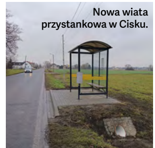
Nowa wiata przystankowa w Cisku.

można robić piękne plenerowe zdjęcia na tle zachodzącego słońca. Sołectwo Folwark doposażyło swój plac zabaw w nową karuzelę, zaś Chrząszczyce postanowiły przeznaczyć swoją dotację na ulepszenie infrastruktury tamtejszego boiska sportowego: zakup nowych ławek i zasiew trawy na murawie.