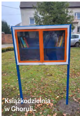
Książkodzielnia w Choruli.

W ramach programu fundacja wsparła w ubiegłym roku siedem projektów, udzielając wsparcia na łączną kwotę prawie 105 tysięcy złotych. Przyznanie grantów zostało poprzedzone cyklem spotkań z mieszkańcami i rozmowami, by rozpoznać najistotniejsze z ich punktu widzenia sprawy, w których Fundacja mogłaby im pomóc.