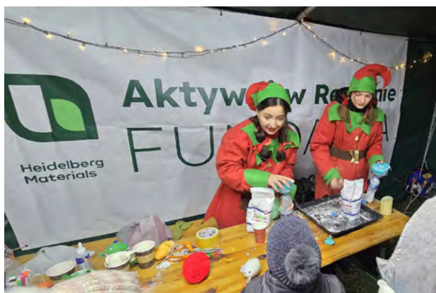
Mikołajki z fundacją w Malni.