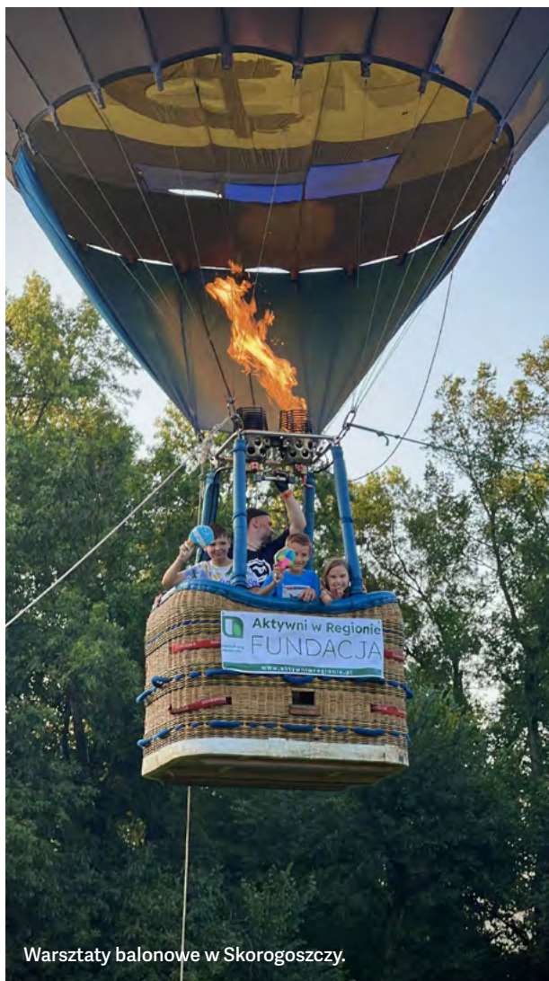
Warsztaty balonowe w Skorogoszczy.