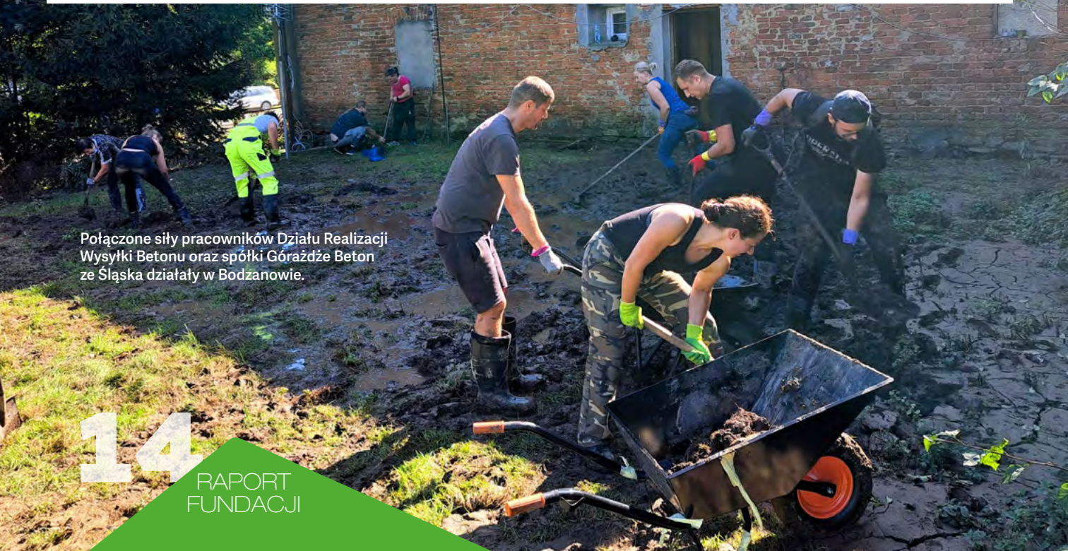
Połączone siły pracowników Działu Realizacji Wysyłki Betonu oraz spółki Górażdze Beton ze Śląska działały w Bodzanowie.

Także i my nie mamy słów, by podziękować naszym wspaniałym wolontariuszom za ten niezwykły dar serca i poświęcenie czasu, by wesprzeć potrzebujących. Pracownicy HM Polska, jesteście niesamowici!