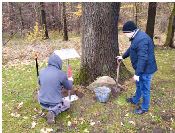
Wolontariat w Kalinowicach.

przygotować miejsce na nowe boksy i wybiegi dla psów. Zainstalowali nowe regały oraz dostarczyli zapas karmy dla psów i kotów. Ta pomoc była szczególnie nieoceniona, bo do schroniska w tamtym czasie trafiło z powodu powodzi mnóstwo zwierząt z terenów dotkniętych powodzią.