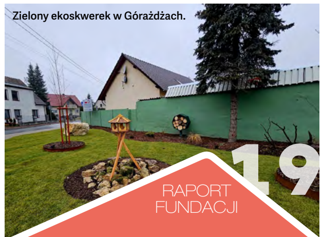
Zielony ekoskwerek w Górażdżach.

Wiosną 2025 roku ponownie wyruszamy na spotkania z Wami, by podczas konsultacji ustalić dalsze kierunki działań i wspólnie rozwijać nasze małe ojczyzny. Do zobaczenia!