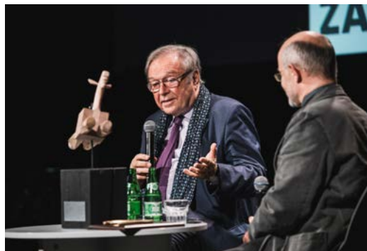
Honorowym gościem XVII Festiwalu Opolskie Lamy był Krzysztof Zanussi

Granty otrzymały już po raz ósmy Stowarzyszenie Opolskie Lamy na organizację XVII edycji Festiwalu Filmowego Opolskie Lamy oraz Stowarzyszenie Literatury i Sztuki „VADE-MECUM” w Rakowicach Wielkich na kolejną odsłonę projektu „Blżej poezji i sztuki”. Dofinansowanie przyznano też Fundacji Fabryka Inspiracji Opole na przygotowanie IV Festiwalu Książki w Opolu oraz Domowi Współpracy Polsko-Niemieckiej na organizację konkursu fotograficznego Fotomaraton „BAUhausowe powroty”. Ze wsparcia Fundacji skorzystały też: Gminny Ośrodek Kultury w Gogolinie, który pozyskane fundusze przeznaczył na urządzenie koncertów muzyki klasycznej oraz Strzelecki Dom Kultury, który zorganizował V Festiwal Jazzowy pod hasłem „Strzeleckie ogrody jazzowe”. Znaczące środki przekazano również na remont zabytkowego muru i kaplicy w Choruli oraz na odnowę kościoła w Głębinowie (pow. nyski).